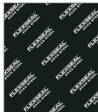
Negro / Negro

Muy buena sellabilidad y propiedades de retención de torque. Diseñado para resistir químicos agresivos, especialmente usados en las industrias químicas, petroquímicas y papeleras.